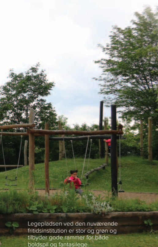
Legepladsen ved den nuværende fritidsinstitution er stor og grøn og tilbyder gode rammer for både boldspil og fantasilege.

Men FSB oplyser til LFS Nyt, at lejemålet ikke er opsagt, og at man afventer lokalplanen for området, før man detailplanlægger området. Og i den aktindsigt, LFS